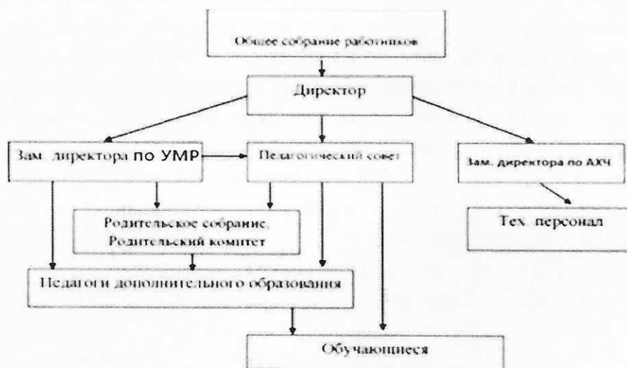
Структура управления Учреждением

Модель управления развитием учреждения представлена следующим образом: